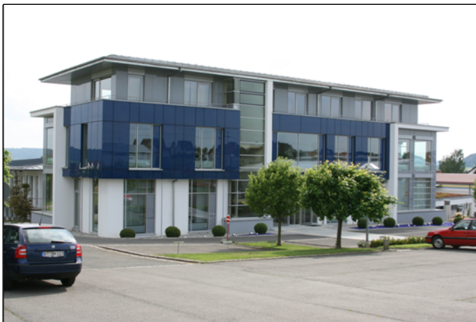
Abbildung 2: Mustergebäude

Die Vermittlung des Wissens in Bezug auf IT-Systeme im FM wird hoch innovativ und praxisbezogen mittels einer Demosimulation unterstützt, die auf einem realen Mustergebäude basiert. Ziel ist die Integration einer umfangreichen Videothek, in der den Kursteilnehmern die verschiedenen Software-Funktionen illustriert werden. Nach erfolgter Illustration haben die Kursteilnehmer unmittelbar die Möglichkeit, ihre Erkenntnisse bezüglich der einzelnen Software-Funktionen in der bereitgestellten Demosimulation eigenständig zu erproben.