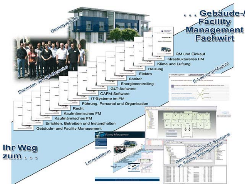
Abbildung 1: Schulungskonzept

Ergebnis ist ein erfolgreich realisierter und im Bildungsmarkt etablierter Lehrgang zur Qualifizierung von Gebäudemanagern/Facility Managern. Der Lehrgang wird von der Handwerkskammer für Oberfranken über das Projektende hinaus bundesweit vermarktet und durchgeführt werden.