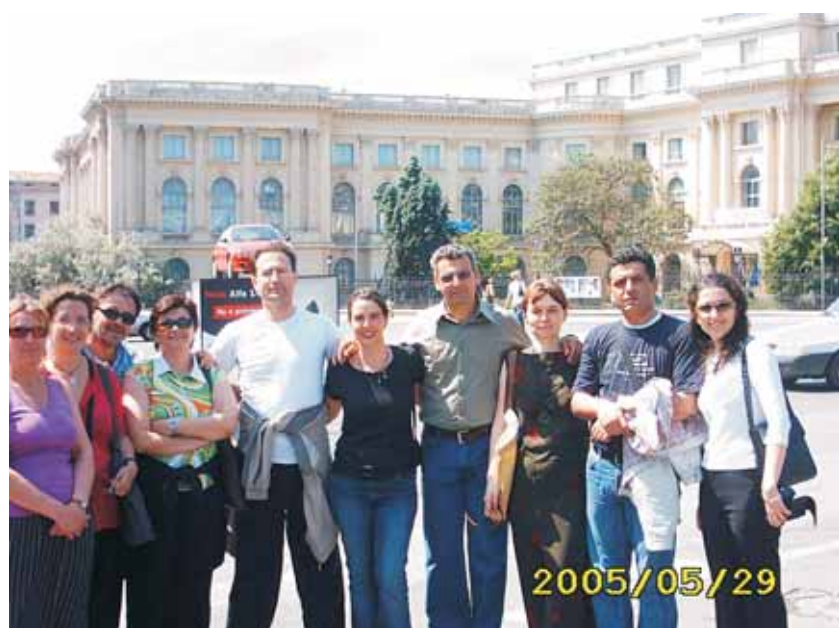
Die Teilnehmer des Kontaktseminars aus Lettland, Zypern, Belgien, Spanien, Türkei sowie Rumänien

Die Skizzen für Projektanträge im Rahmen der Gruntvig-Lernpartnerschaften können bis zum März 2006 bei der Nationalen Agentur eingereicht werden.