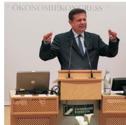
Frank Schirmmacher, FAZ

Neben den Vorträgen zeichnet sich der Bayreuther Ökonomiekongress immer auch durch die Messestände aus, an denen sich die Gäste über die Partnerunternehmen des Kongresses informieren können. Und dann wäre da noch die einzigartige Atmosphäre: die moderne Architektur des Audimax, umgeben von einer Zeltlandschaft, einem liebevoll hergerichteten Biergarten, einer Strandbar zum Entspannen und einem Pflanzen- und Blumenmeer in grün und weiß – den Farben des Bayreuther Ökonomiekongress.