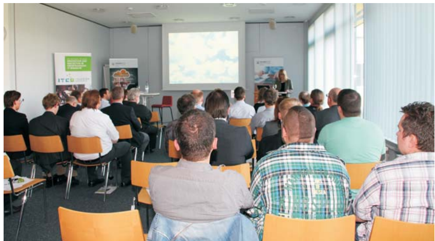
Das interessierte Auditorium der gut besuchten Veranstaltung

Mittelstand- Digital Usability eStandards eKompetenz-Netzwerk