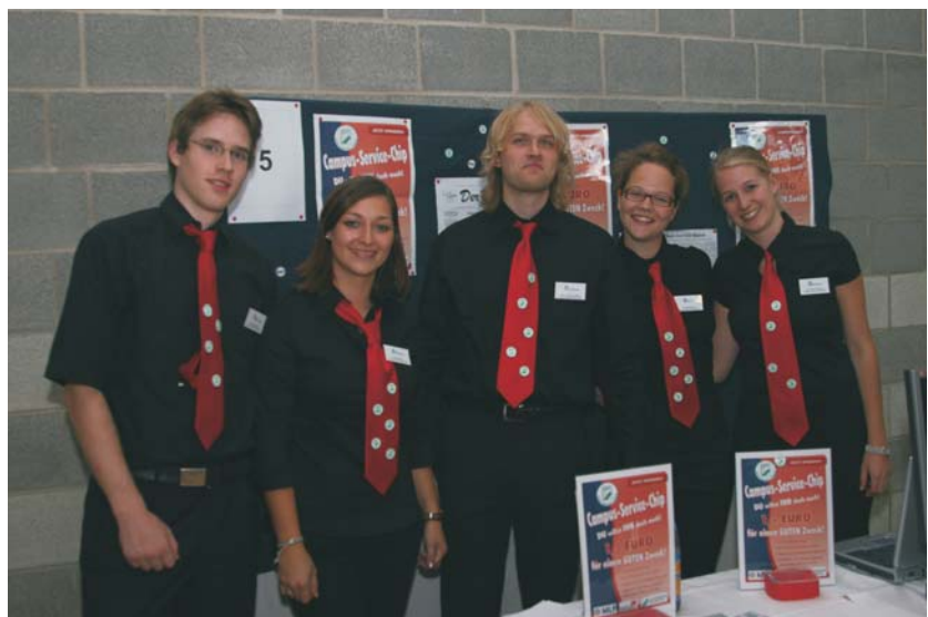
Konnten die Jury mit ihrer Idee überzeugen: Die "Campus Service Chip GbR" belegte den ersten Platz beim 5-Euro-Business 2007