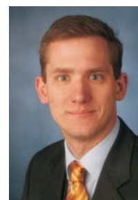
Autor: Dr. Gunar Tewes ist wissenschaftlicher Mitarbeiter am BFM

van Hippel, E. (2001), Learning from Open-Source Software, in: MIT Sloan Management Review, Vol. 42, S. 82 – 86.