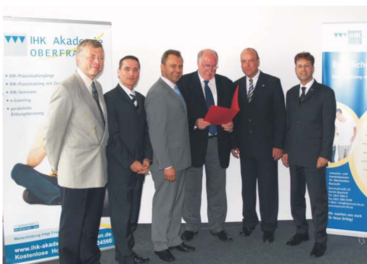
Förderbescheidübergabe für das Projekt „Karriereplattform Oberfranken“ durch Regierungspräsident Wilhelm Wenning

Das Teilprojekt „Aufbau eines ‚Netzwerkes Personalkompetenz‘“ wurde im November mit einer Umfrage gestartet. Diese dient zum einen dazu, den Status quo der Personalarbeit in KMU zu ermitteln sowie das individuelle Kompetenz- und Problembewusstsein der Unternehmen zu sensibilisieren. Zum anderen verfolgt die Befragung das Ziel, bestehende unternehmensübergreifende Kooperationen zu Personalthemen zu erfassen und die Bereitschaft kleiner und mittlerer Betriebe dazu aufzudecken.