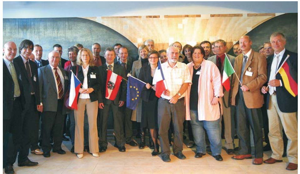
Die Vertreter von Bildungseinrichtungen aus fünf europäischen Ländern bei der Abschlusskonferenz in der HWK in Bayreuth

alle Automarken wie AUDI, BMW, Skoda, Fiat, Ford oder Peugeot europaweit warten und reparieren. Das Projekt „Blended-Learning-Konzept für Auszubildende im Sektor Car-Mechatronic“ (BLCM) macht sichtbar, dass klassische Ausbildungskonzepte angesichts der Fülle des zu vermittelnden Wissens und der zunehmenden Komplexität der technischen Systeme immer mehr an ihre Grenzen stoßen und neue Lernformen entwickelt werden müssen.